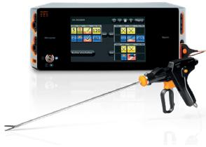
Toestel voor electrochirurgie