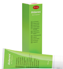
Preventie en behandeling van vochtletsels