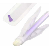
Système de fermeture cutanée