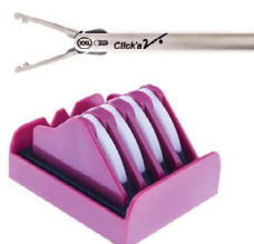
Clips de ligature en polymère