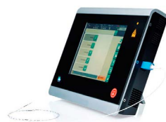
Procédure laser mini-invasive