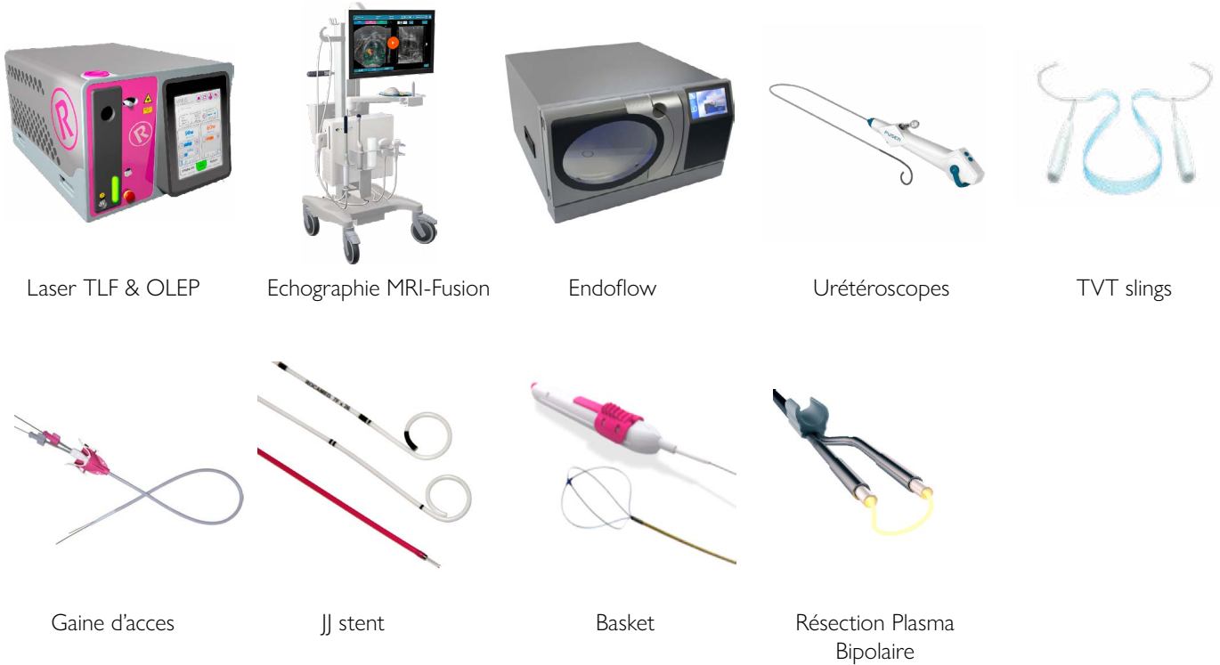
Laser TLF & OLEP