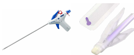
Colle chirurgicale Système de fermeture cutanée