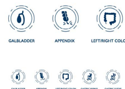
Trousses de procédures