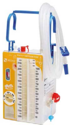
Système de drainage thoracique