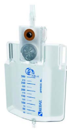
Système de drainage thoracique portable