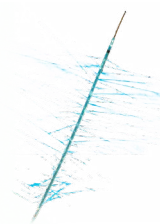
Cathéter de perfusion pour thromolyse