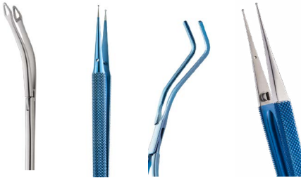
Instruments de haute précision