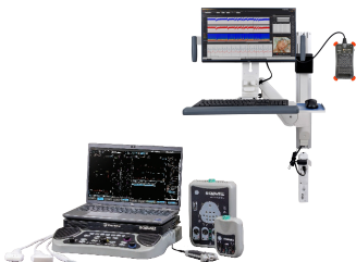
EMG – EP – Ultrasound EEG – LTM - ICU Cadwell