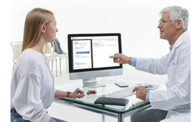
SentrySuite: Gestion des Informations Clinique