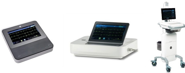
Échocardiographie au repos: MAC5 - MAC7 - MACVU360