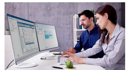
Cadlink: Gestion des Informations Clinique