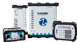
Surveillance neuro-physiologique peropératoire Cascade IOMAX