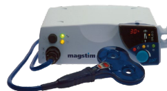
Simulation magnétique Magstim