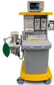
Ventilateur d'anesthésie MRI