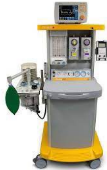
Ventilateur d'anesthésie MRI