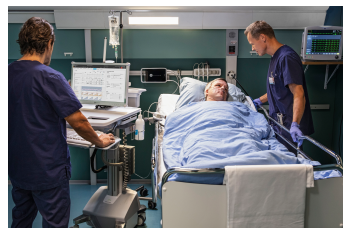
CHA Critical Care