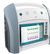
Ventilation des nouveaux-nés