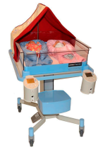
BabyBed & BabyWarmer