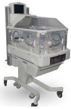
Incubateurs et lits chauffants