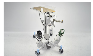
Table de réanimation flexible