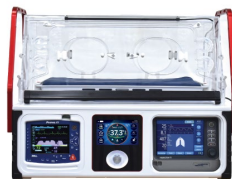
Incubateur de transport