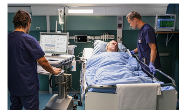
Centricy Neonatal Critical Care