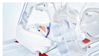
Systèmes de retenue néonatale