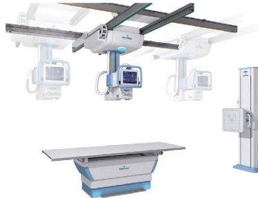
Salles de rayons X