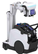
Systèmes mobiles de rayon X