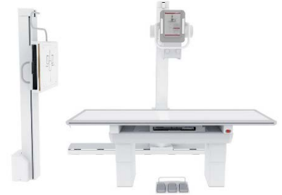
Systèmes au sol