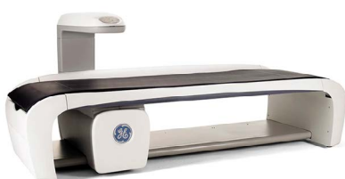
BMD: Bone Mineral Density