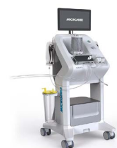
Lipo & Fill System