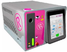
Laser TLF & OLEP