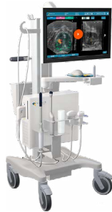
MRI fusie biopsie