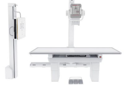
Systèmes au sol