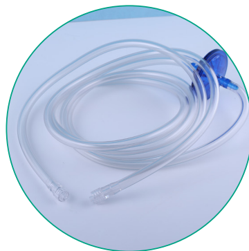
TUBULURE AVEC FILTRE HYDROPHOBE POUR CO 2