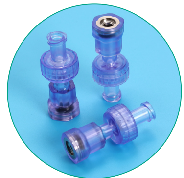
CONNECTEUR WATER JET